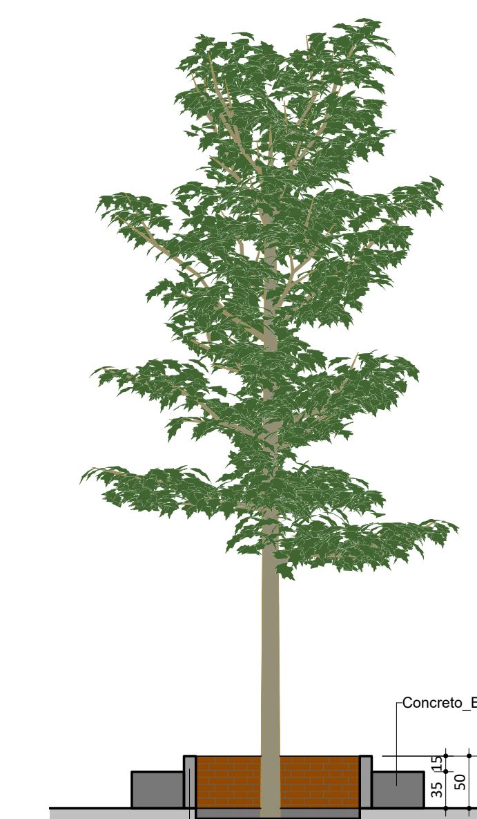
FDE: S713_AterroadoTipoLimnadoVista_1/27polaAlternado CORTE CANTEIRO ESC: 1:50